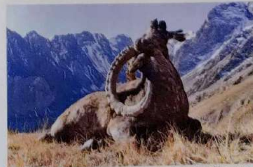
Dignes du format cinémascope, les paysages tadjiks offrent aux trophées comme avec ce premier ibex un décor d'une exceptionnelle dimension.

rien, aussi dans l'après-midi nous postons-nous au sol avec l'espoir d'entendre ces fameux bruits. C'est dans notre dos que ces premiers craquements retentissent. Un monstre apparaît, un magnifique solitaire à l'armure impressionnante. Il est à 80 m. B. se cale et à mon invitation lâche sa balle. Parfaite. Vu les deux quintaux qu'avoisine ce mâle, je lui demande de doubler. » L'extraction des défenses révèle des longueurs de 26,9 cm et 27,1 cm, et une régularité remarquable, chose pas évidente étant donné l'environnement pierreux. Le sanglier d'une vie, outre deux grands ibex. Généreux Tadjikistan, O. B.