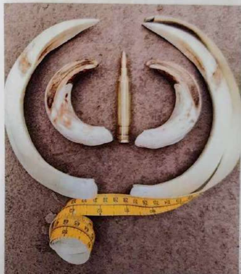
D'une régularité quasi parfaite, l'imposant trophée de ce grand solitaire est remarquable, ce qui est rare dans un tel environnement.